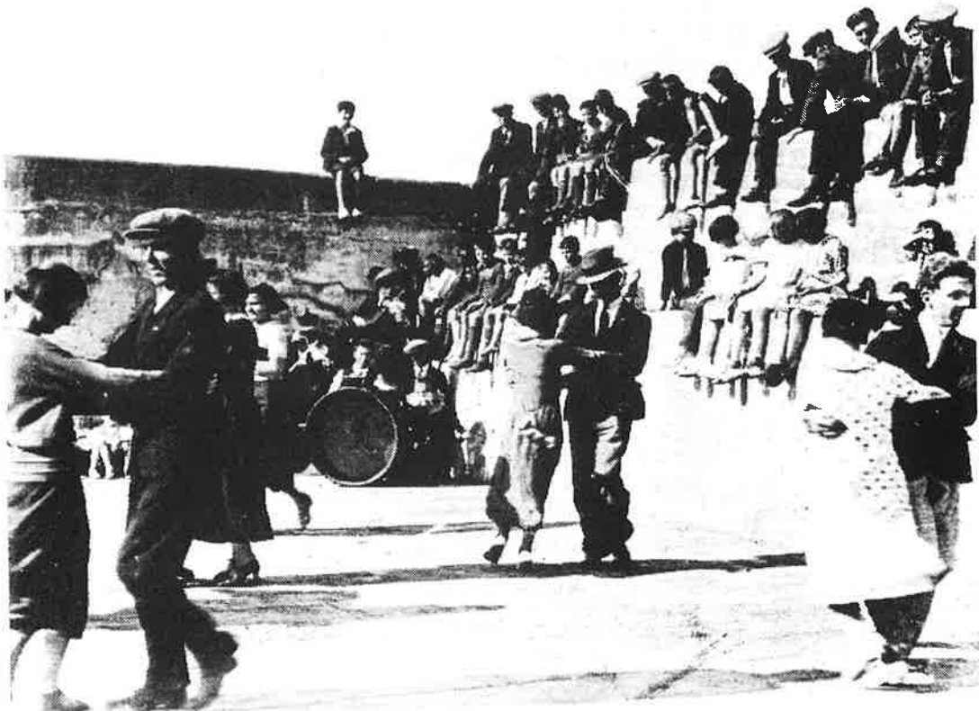
Rince i gCé Bhréanainn 1935

Bhíodh a dó nó a trí de chamáin aitinn ag gach imreoir ar eagla go mbrisfí aon cheann acu. Imríodh cuid mhaith trap ag, Mám na Gaoithe. Nuair a bhreáthaíodh an séasúr a thosnaíodh an cluiche trap.