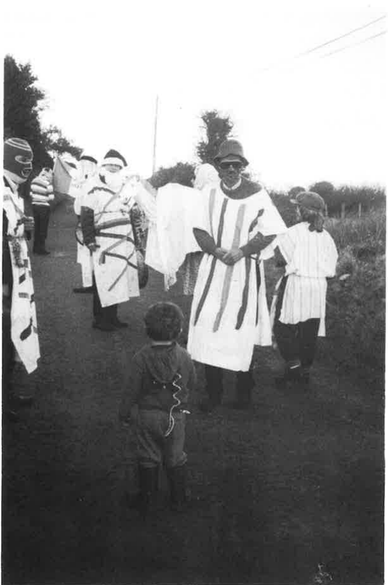
An Dreoilín i gClochán Bhréanainn